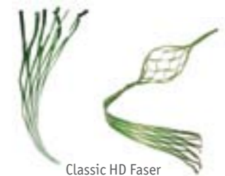
Classic HD Faser